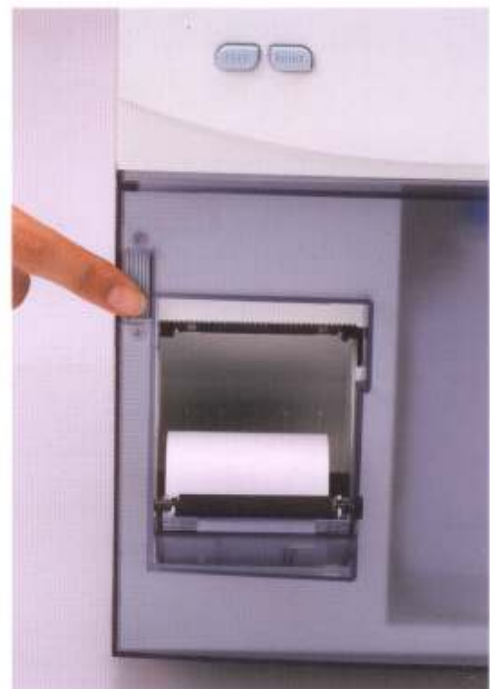
Very easy to set printing paper ワンタッチでプリント用紙をセットできます。